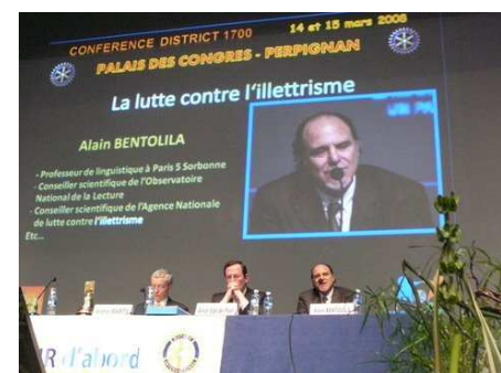
La conférence d'Alain Bentolila

Une fois de plus les absents ne peuvent que regretter !