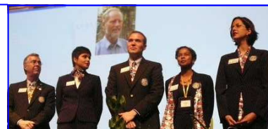
Les EGE à la Conférence de Perpignan

Nous avons fabriqué les "mochis", gâteaux spéciaux du nouvel an japonais, j'ai aussi aidé à la préparation des offrandes pour les dieux et de "sechi-ryori" cuisine spéciale du nouvel an japonais.