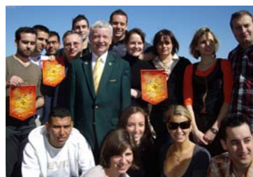
Le fanion du D 1700 en de bonnes mains