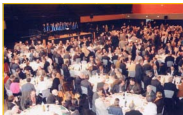
Plus de 500 convives au déjeuner du samedi