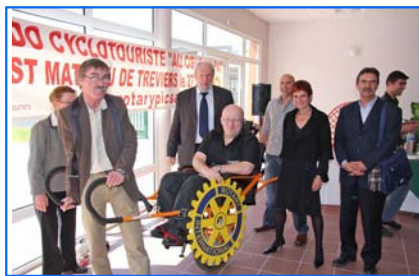
Essai de la « joëlette »