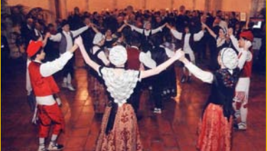
Une Conférence de District à Perpignan ne pouvait s'envisager sans la traditionnelle « Sardane ».