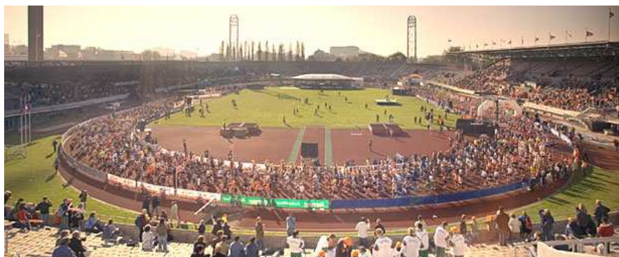
OLYMPIC STADIUM AMSTERDAM